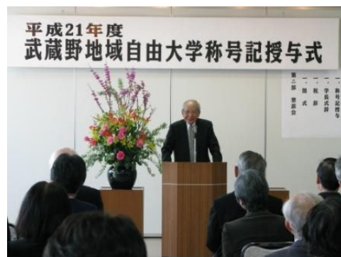
自由大学長倉学長より挨拶。

※ 現在の講座数を知りたい場合は、自由大学事務局 (0422-20-6340) までお問い合わせください。