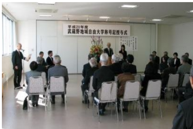
窓が大きく、明るい会場での称号記授与式。会場にあたたかな日差しが差し込みます。