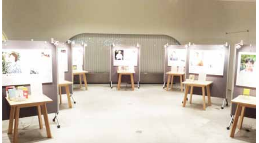
▲昨年8月開催の市活人展の様子