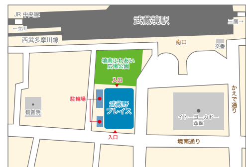
武蔵境駅南口 徒歩1分

〒180-0023 武蔵野市境南町 2-3-18 武蔵野プレイス 3階自由大学事務局 TEL 0422-30-1904 FAX 0422-30-1960 E-mail jiyu-daigaku@musashino.or.jp 休館日 水曜日(祝日と重なる場合は開館し、翌日休館) 毎月第3金曜日 (その週の水曜日は開館)、年末年始、図書特別整理日