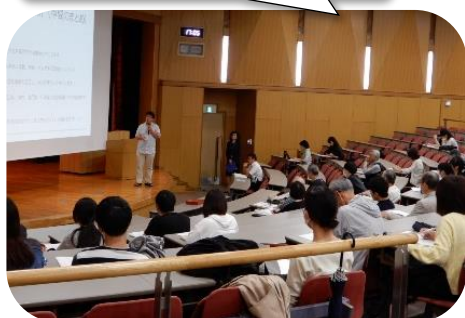
平成 30 年度寄付講座の様子