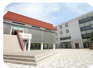
日本獣医生命科学大学 獣医／応用生命科学