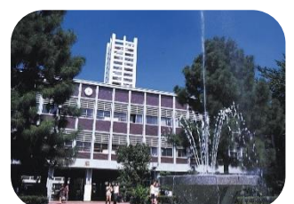
武蔵野大学 文／人間科学／経済