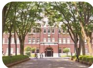
成蹊大学 経済／文／法／理工／学 部共通（成蹊教養カリキュラム）