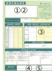
自治体・勤務先発行